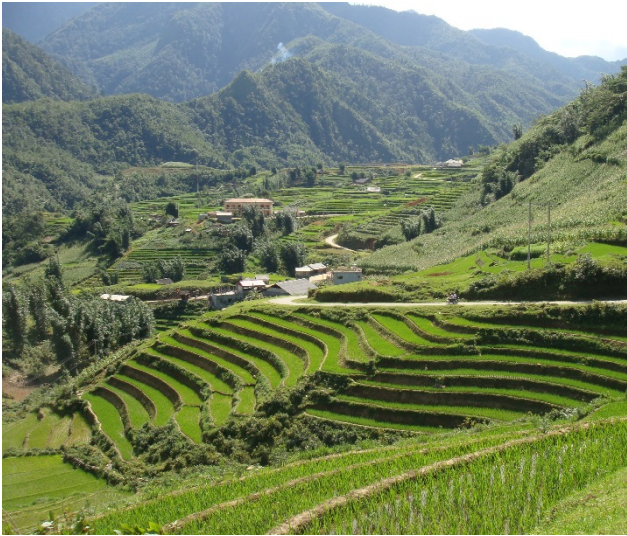
Village de Ta Van

Du jeudi 1 er au dimanche 18 septembre 2016